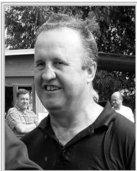
Po vítězné koupeli v požární nádrži