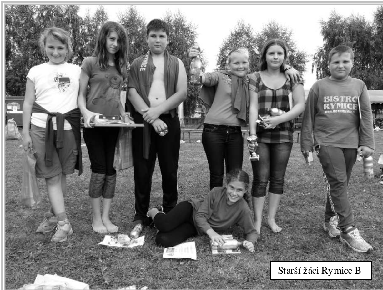
Starší žáci Rymice B