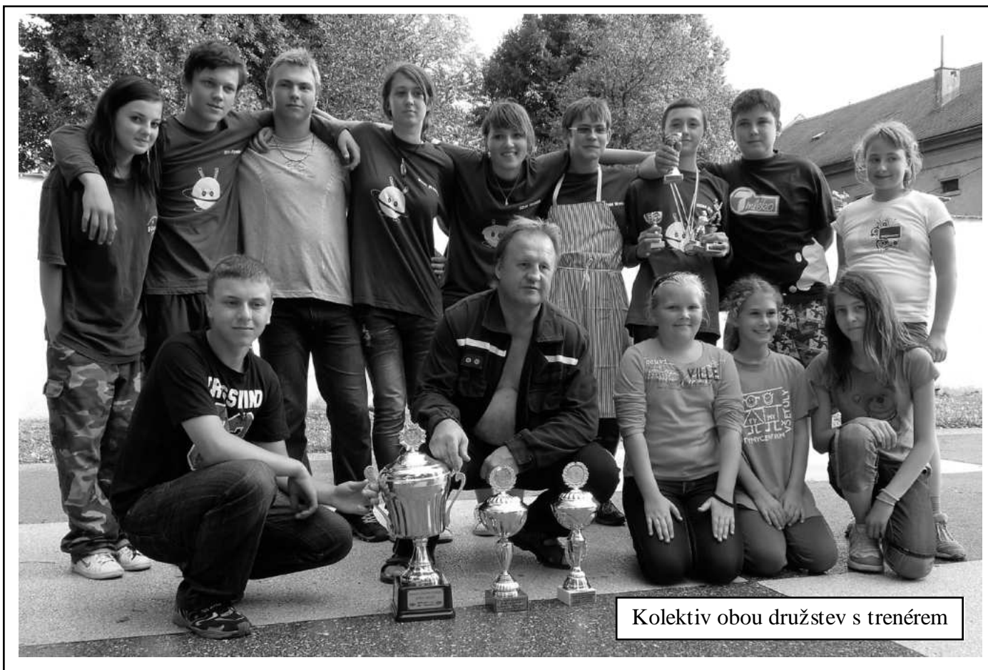
Kolektiv obou družstev s trenérem